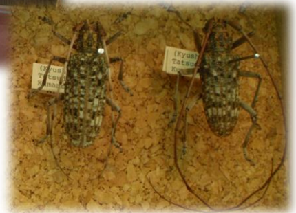
マツノマダラカミキリの成虫 →

5月11日に「虹の松原周辺松くい虫被害箇所総点検」が開催されました。この総点検は、佐賀県森林管理署が通常実施している松くい虫の被害木の点検作業に加えて、より多くの人の目で被害木を探し「見逃し」を可能な限り減らし、早期に伐採・焼却することで材の中にいるカミキリの幼虫を駆除し、ヘリコプターを利用した防除活動と合わせて松くい虫被害を最小限にとどめることを目的に毎年1回開催されています。当日は、朝からあいにくの雨模様で「国民宿舎 虹の松原ホテル」内で説明会のみが開催されましたが、普段より虹の松原に関わっているボランティア団体、学校、それから行政等から約65名が参加されていました。