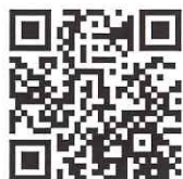
2020年10月の KPPの様子が ご覧いただけます。